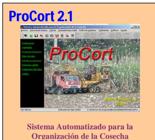
Sistema Automatizado para la Organización de la Cosecha

INICASoft ha desarrollado este producto teniendo como base 4 décadas de conocimientos científicos agrícolas en caña de azúcar.